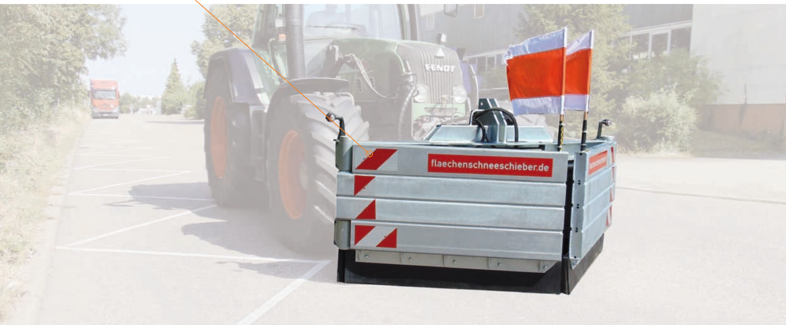
Abbildung FL 540, technische Änderungen vorbehalten.

Gummilippe - Ermöglicht sauberes Schieben ohne den Untergrund zu beschädigen